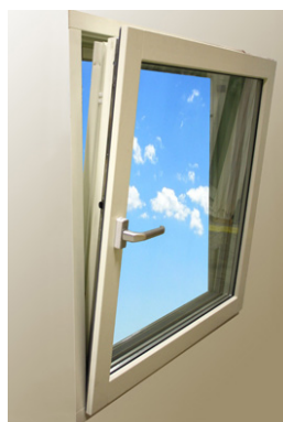
3. Vådringsläge (Kipp)