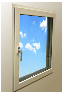
1. Stängt läge