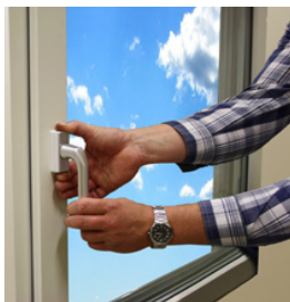
2. Kläm ihop och vrid