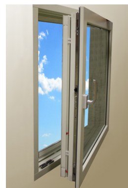
4. Öppet läge (Dreh)